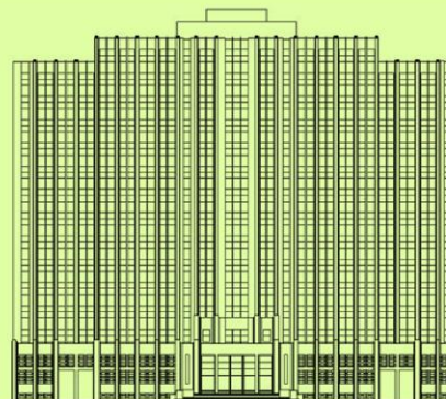
TRIBUNAL REGIONAL DO TRABALHO DA 1ª REGIÃO

Acessibilidade Compromisso e Participação Credibilidade Eficácia e Eficiência Ética Responsabilidade Socioambiental Transparência