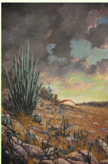
Ceará - 1938

Pintor e desenhista. Recebe bolsa de estudos do governo do Ceará, por volta de 1920. Muda-se para o Rio de Janeiro, onde frequenta a Escola Nacional de Belas Artes. O pintor foi companheiro de turma de Portinari, que o retratou em 1923.